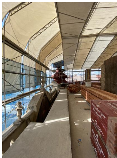
Šaldova 22, Praha 8 - Karlín realizace 2020-2021