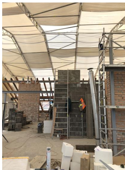
Lípová 14, Praha 2 – Nové Město realizace 2019-2020