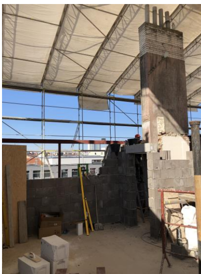
Rostislavova 8, Praha 4 - Nusle realizace 2019-2020