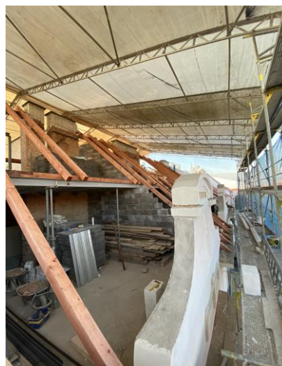
Laubova 3, Praha 3 - Vinohrady realizace 2019-2020